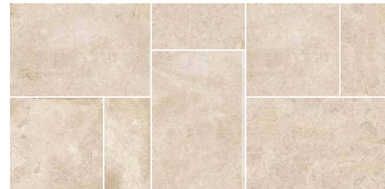
4200898 • BOX MULTIFORMATO BEIGE R10 ■ 157