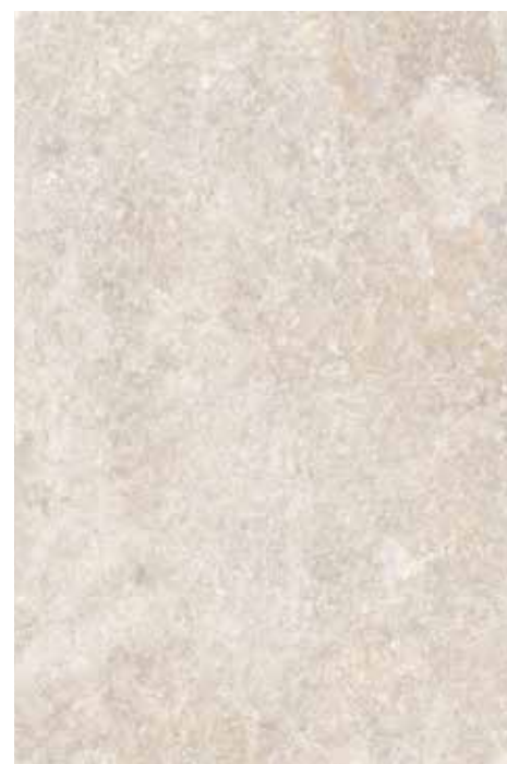
4200943 • 40,5X61/16"x24" R10 ■ 126 4201180 • 40,5X61/16"x24" R11 ■ 126