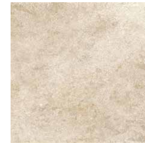
4200940 • 40,5X40,5/16"x16" R10 ■ 157