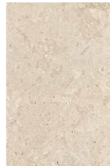
4200944 • 40,5X61/16"x24" R10 ■ 126 4201181 • 40,5X61/16"x24" R11 ■ 126