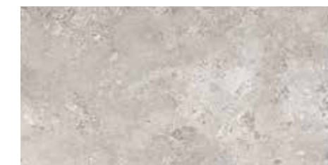
4200937 • 20X40,5/8"x16" R10 ■ 157