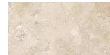
4200936 • 20X40,5/8"x16" R10 ■ 157