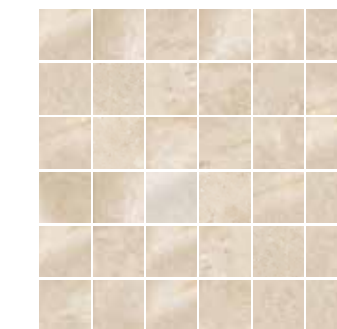
4200952 • MOSAICO ▲ 37