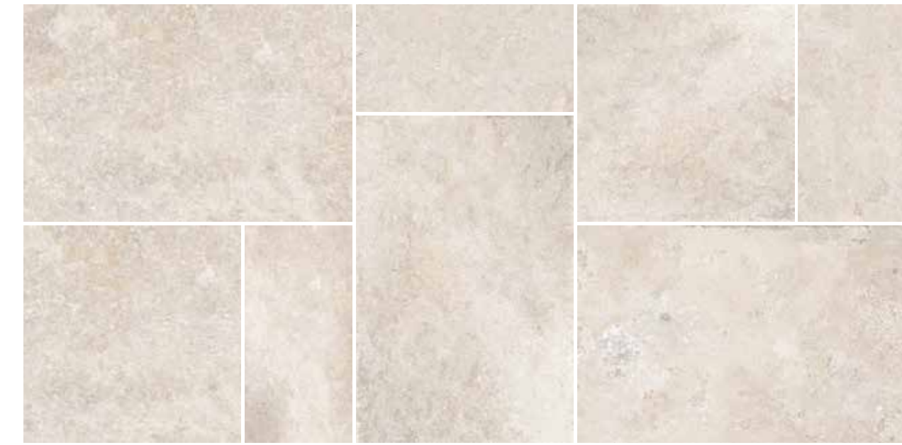
4200897 • BOX MULTIFORMATO BIANCO R10 ■ 157