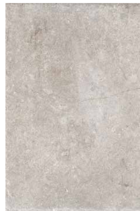
4200945 • 40,5X61/16"x24" R10 ■ 126 4201182 • 40,5X61/16"x24" R11 ■ 126