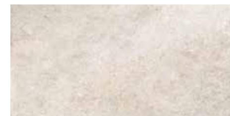
4200935 • 20X40,5/8"x16" R10 ■ 157