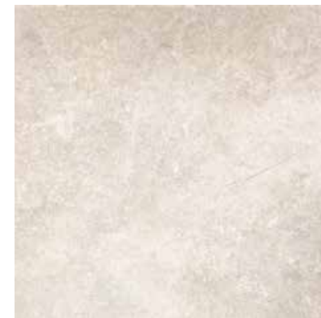
4200939 • 40,5X40,5/16"x16" R10 ■ 157