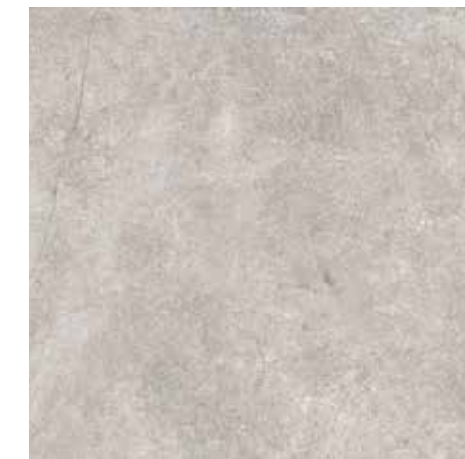
4200941 • 40,5X40,5/16"x16" R10 ■ 157