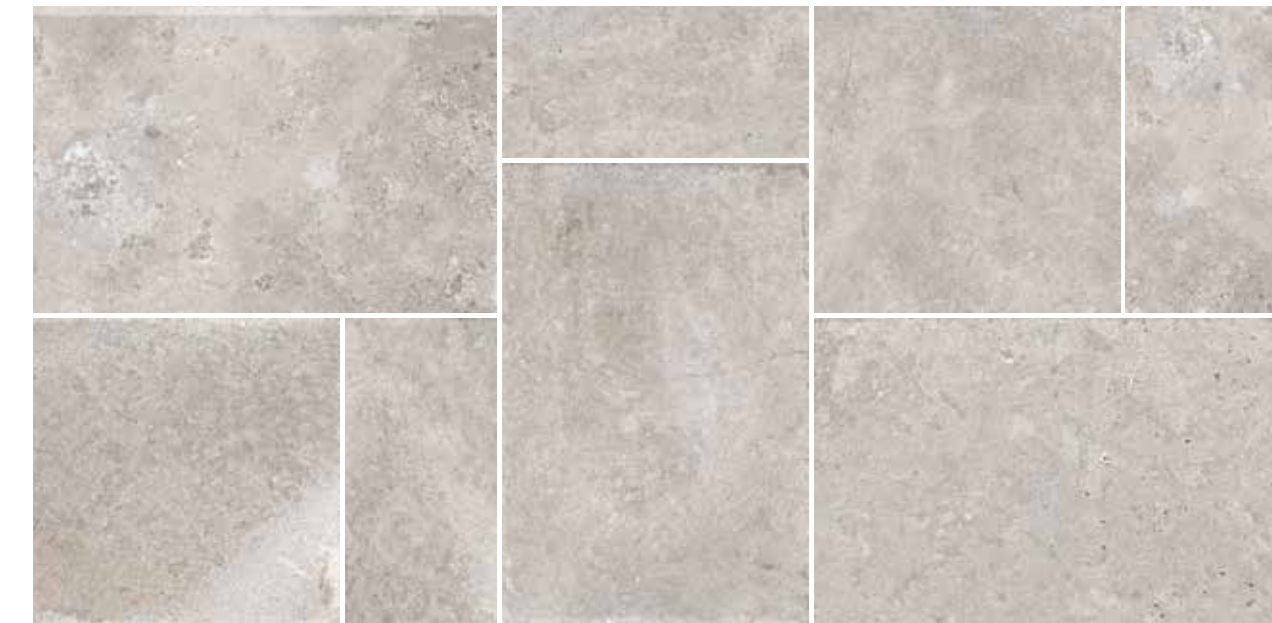
4200899 • BOX MULTIFORMATO GRIGIO R10 ■ 157