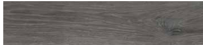
4201424 GRIGIO 20,3x90,6 - 8"x35" R9