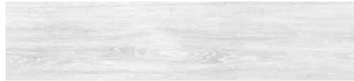
4201421 BIANCO 20,3x90,6 - 8"x35" R9

GRES PORCELLANATO SMALTATO _ SUPERFICIE NATURALE - GLAZED PORCELAIN TILE _ NATURAL SURFACE