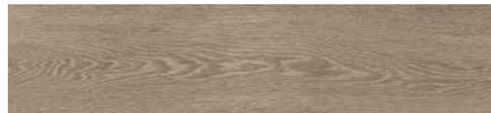
4201423 GOLDEN 20,3x90,6 - 8"x35" R9