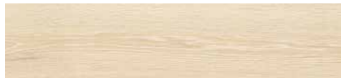
4201422 BEIGE 20,3x90,6 - 8"x35" R9