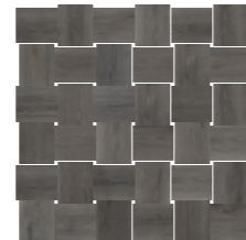
4201461 MOSAICO INTRECCIO 30x30 - 12"x12"