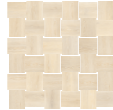
4201459 MOSAICO INTRECCIO 30x30 - 12"x12"