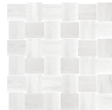
4201450 MOSAICO INTRECCIO 30x30 - 12"x12"