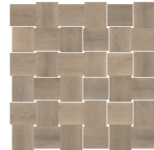
4201460 MOSAICO INTRECCIO 30x30 - 12"x12"