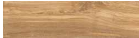
4201544 MIELE 17x62 - 7"x24" R9

GRES PORCELLANATO SMALTATO _ SUPERFICIE NATURALE - GLAZED PORCELAIN TILE _ NATURAL SURFACE