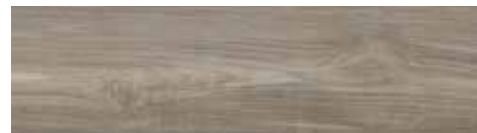
4201543 FUMO 17x62 - 7"x24" R9