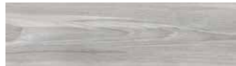
4201542 GRIGIO 17x62 - 7"x24" R9