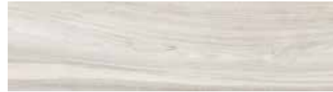
4201545 BIANCO 17x62 - 7"x24" R9