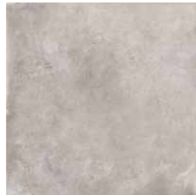
4201431 FUMO 60,4x60,4 - 24"x24" R10 4201435 FUMO OUT 60,4x60,4 - 24"x24" R11