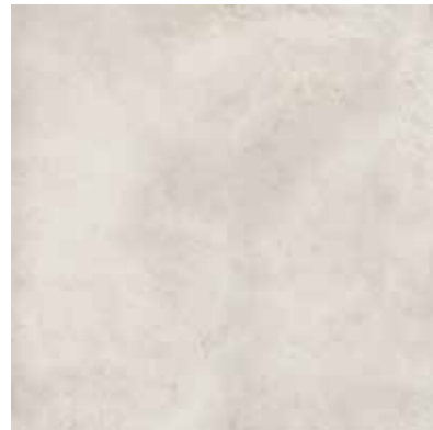
4201429 GHIACCIO 60,4x60,4 - 24"x24" R10 4201433 GHIACCIO OUT 60,4x60,4 - 24"x24" R11

GRES PORCELLANATO IMPASTO COLORATO _ SUPERFICIE NATURALE - COLORED BODY PORCELAIN TILE _ NATURAL SURFACE