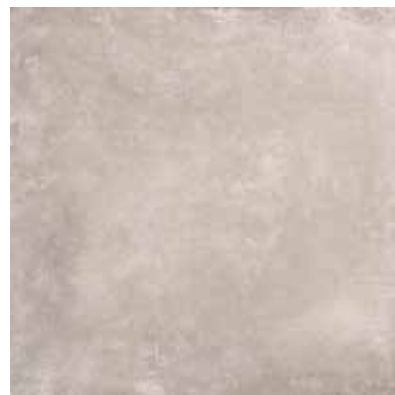
4201430 FANGO 60,4x60,4 - 24"x24" R10 4201434 FANGO OUT 60,4x60,4 - 24"x24" R11