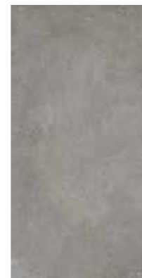
4201428 GRAFITE R10 30x60,4 - 12"x24"