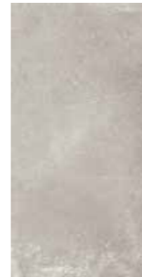
4201427 FUMO R10 30x60,4 - 12"x24"