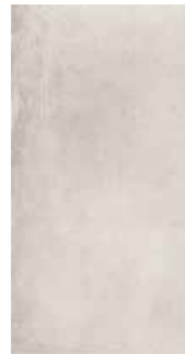
4201425 GHIACCIO R10 30x60,4 - 12"x24"