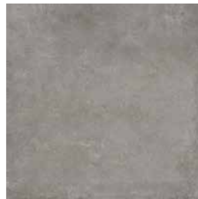
4201432 GRAFITE 60,4x60,4 - 24"x24" R10 4201436 GRAFITE OUT 60,4x60,4 - 24"x24" R11